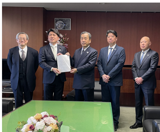
手交の様子(集合写真)